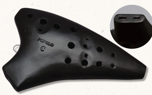
〈品番〉D-AC 価格(税込) ¥39,900