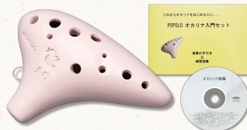
〈品番〉ピンク NAC-P ブラック NAC-B 価格(税込) ¥7,875

持ちやすく吹きやすいコンパクトサイズのアルトC管に、教則楽譜本とCDがついた初心者のための入門セットです。色はポップな「ピンク」とシックな「ブラック」を用意しました。教則本は「まずは吹いてみましょう」の趣意で、説明は極めてシンプルに抑え、コンパクトな冊子の中に「ちょうちょ」に始まるおなじみの入門25曲の歌詞つき楽譜をぎっしりとつめこみました。持ち歩きにもたいへん便利です。CDはオカリナ奏者のアレンジによる伴奏付きの模範演奏です。