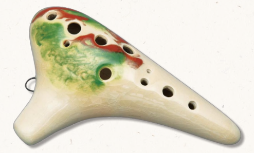
〈品番〉Y-AC 価格(税込) ¥18,900

釉彩をかけることにより、塗り物では表現できない「焼き物」としての質感を大切に、中国の「唐三彩」をイメージさせるオカリナです。表面には貫入(かんにゅう)と呼ばれる細かいひび模様が入っています。色柄やひび模様は焼成段階での偶発の産物から生まれるもので、同じ模様は世界にふたつとありません。(製品の性格上、色柄や模様の指定はできません。また、限定生産品ですので、納期等は販売店におたずねください。)